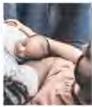
Eine Geburtsurkunde bringt dem Säugling einen Menschen.

Der Online-Wegweiser für Eltern ist über das Handy und das Computer aufrufbar und enthält anhand von Grafiken, Anlauf und Telefon die Kontaktdaten auf dem Weg zur Geburtsurkunde. Mit wenigen Klicks können Eltern in drei Sprachen Deutsch, Englisch und Arabisch hören oder lesen, wie sie es tun müssen, nachdem ihr Kind auf die Welt gekommen ist, oder was es für Möglichkeiten gibt, wenn sie keine Personalakten besitzen.