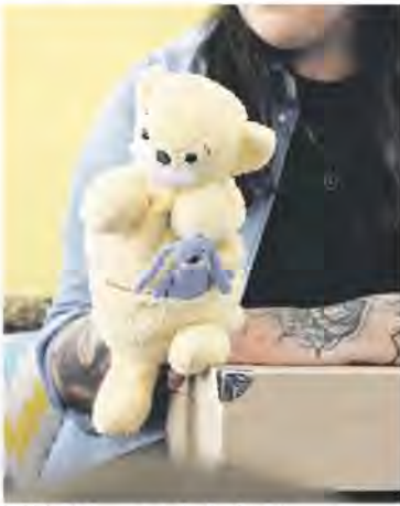
Der „Fluffi-Klub“ ist ein Projekt des Vereins Nicosas Deutschland.

Dienstag, 16. Mai 2025 | tagesspiegel.de