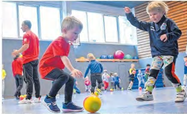
Spielerische Ballübungen gehören zum Sportsonntag in der Sporthalle der Luisenschule dazu. Mit Eifer sind etwa 40 Kinder mit ihren Eltern dabei. Das kostenfreie Angebot für Familien organisiert das Gesundheitsamt der Stadt mit dem Stadtsportbund. Bisher haben es dort mehr als 3000 Kinder genutzt.